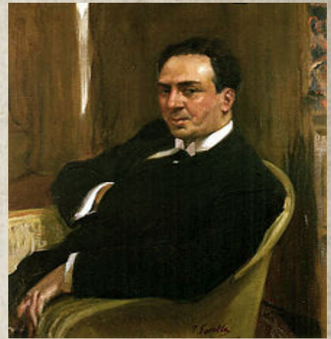
Joaquín Sorolla, Antonio Machado (diciembre de 1917).